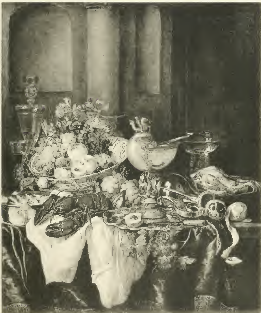
A. VAN BEYEREN

TERCENTENAIRE DE REMBRANDT - EXPOSITION FREDERIK MULLER & CIE.